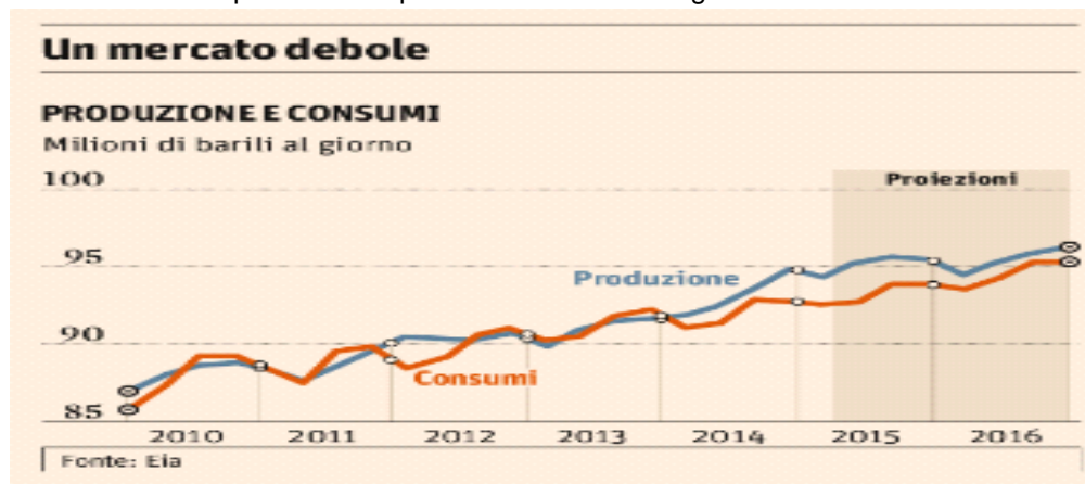
Grafico n°1 : comparazione di produzione e consumi giornalieri

Dal grafico si evince che nel 2015 e nel 2016 la produzione crescerà più dei consumi