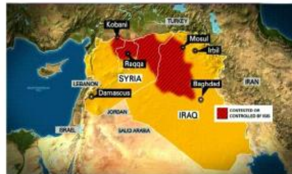
Territori controllati dall'ISIS